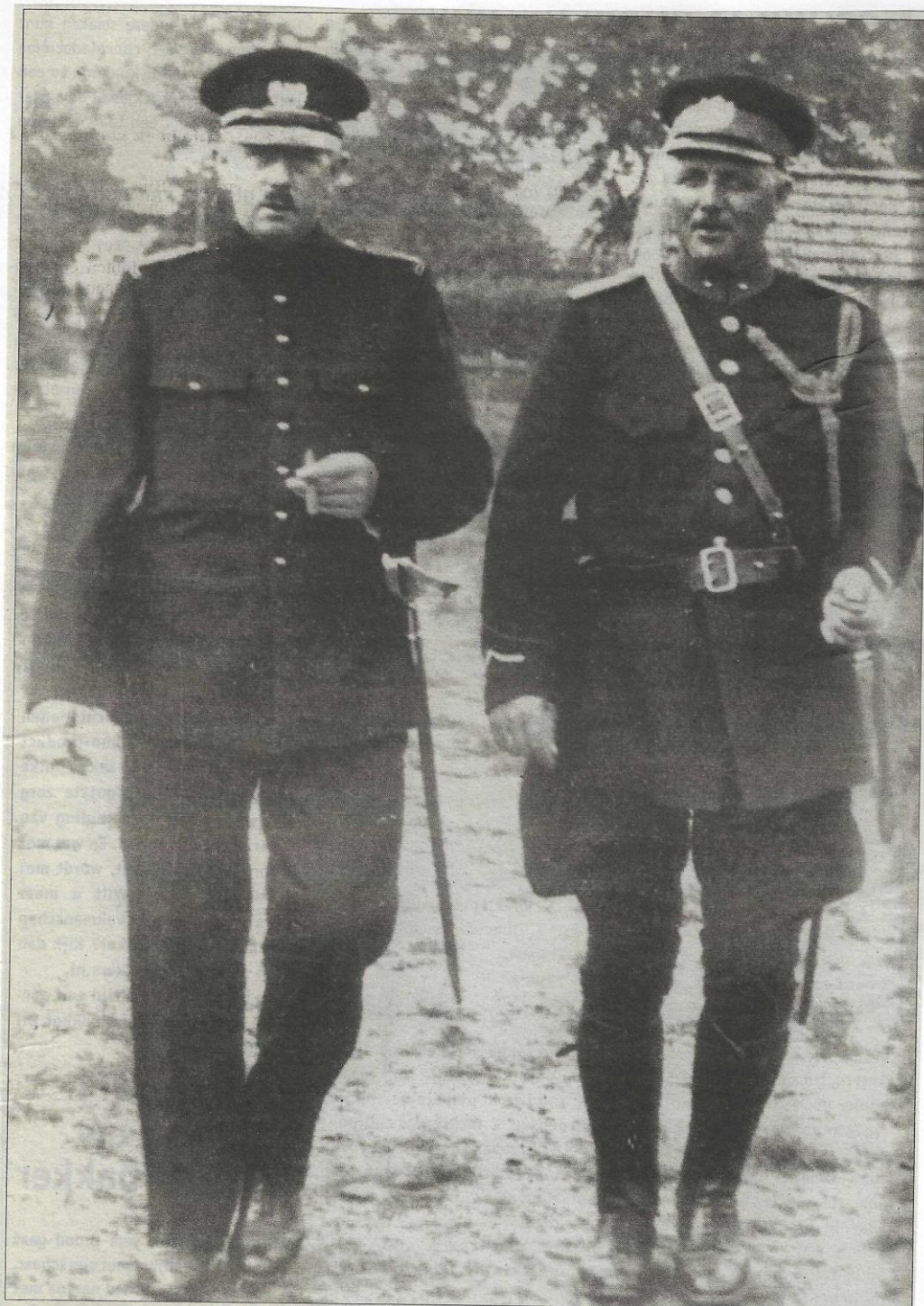
Gemeenteveldwachters in Opsterland rond 1925. Sabels behoorden lang tot de standaarduitrusting. Een sigaretje roken tijdens de dienst was nog normaal.